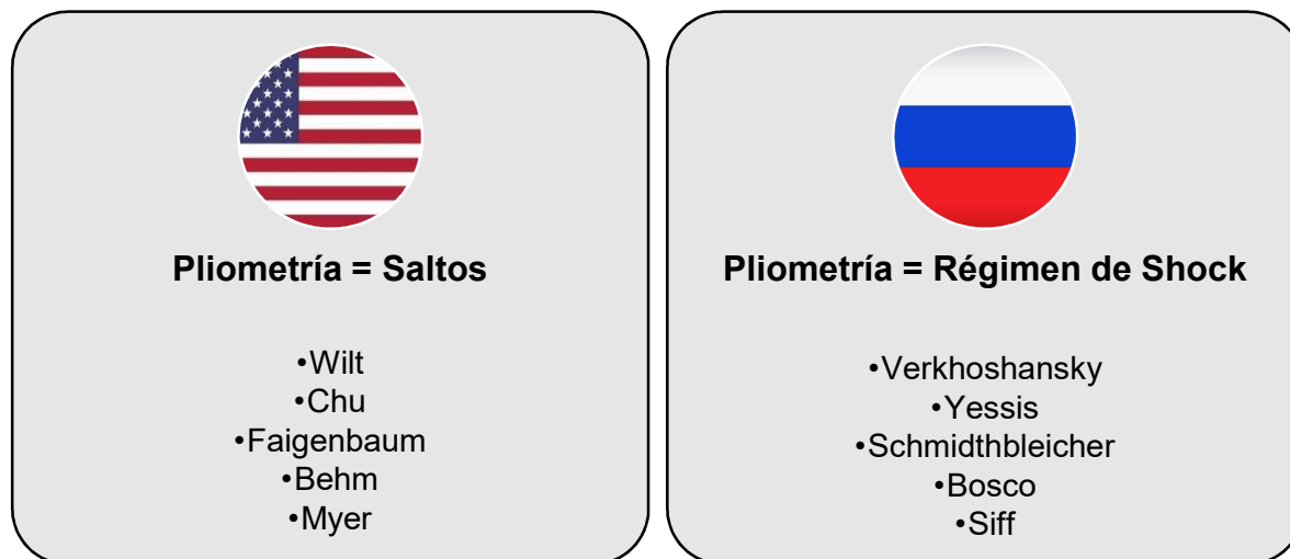
Figura 2. Interpretación de “Pliometría” según el contexto histórico.

La solución en este caso es, a mi parecer, mucho más sencilla, solo basta con leer el protocolo de entrenamiento que fue utilizado en la intervención para discernir (dependiendo de nuestra interpretación de pliometría) si es que se refieren a pliometría o no.